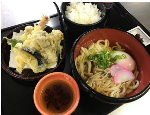
月見天ぷら御膳(うどん) 1,180円