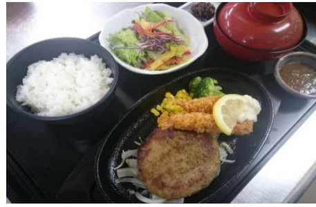
てごねハンバーグ&エビフライ定食 1,280円