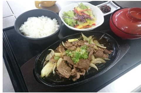
牛肉のスタミナ定食