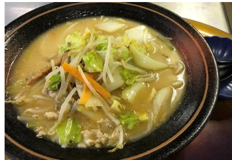
福山ちゃんぽん 900円 (名物じゃこ天入り)