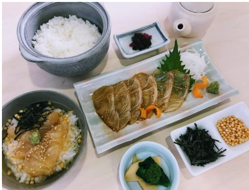
new さくら鯛の漬け御膳 1,300円 (漬け丼と鯛茶漬けで二度おいしく)