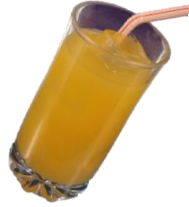
オレンジジュース 300円