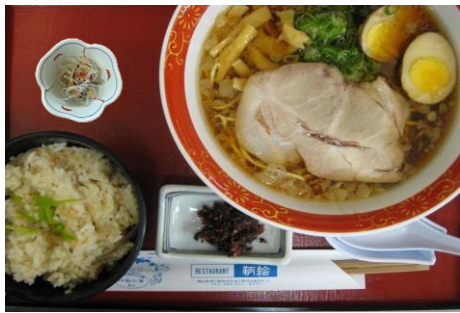
尾道ラーメンセット(鯛めし付) 1,100円