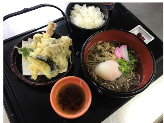
月見天ぷら御膳(そば) 1,180円