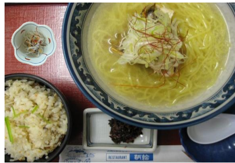
鯛潮ラーメンセット(鯛めし付) 1,050円