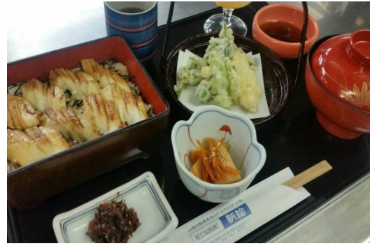
穴子蒲焼重御膳 1,380円 (天ぷら、小鉢、みかんゼリー)