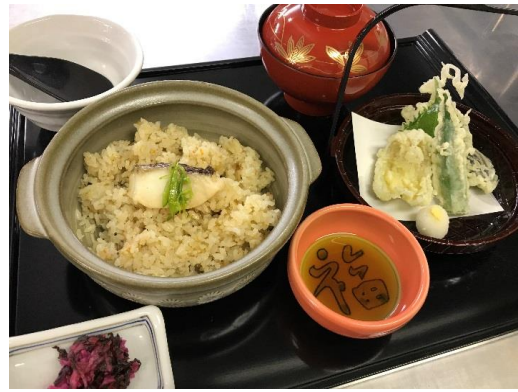
鯛の蒲御膳 (鯛めし) 1,100円