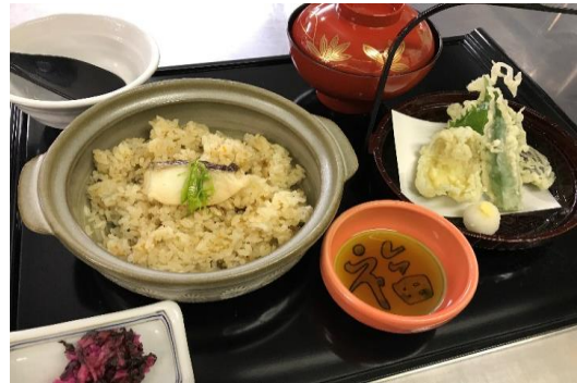
鞆の浦御膳 (鯛めし) 1,100円