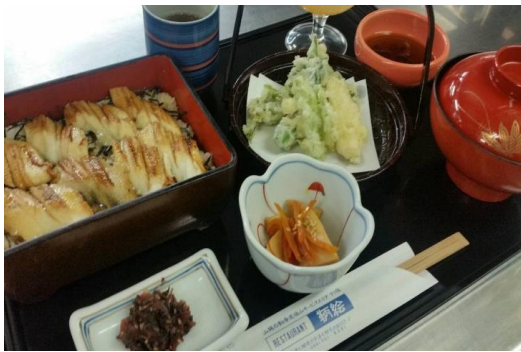
穴子蒲焼重御膳 1,380円 (天ぷら、小鉢、みかんゼリー)