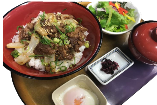
牛肉のスタミナ丼セット 1,200円