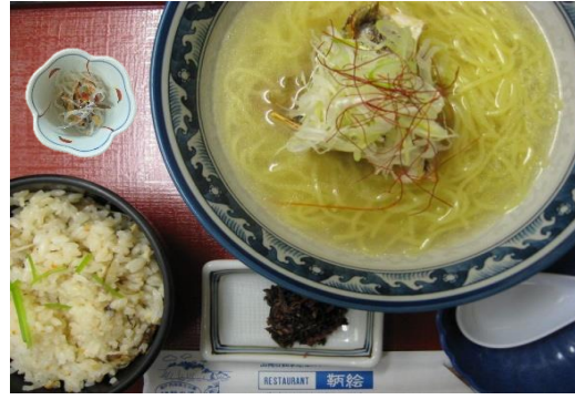
鯛潮ラーメンセット (鯛めし付) 1,050円