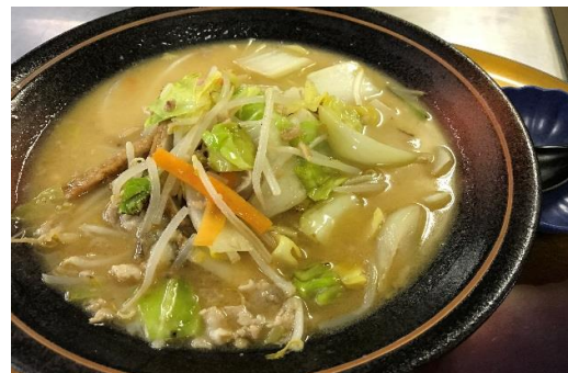
福山ちゃんぽん 900円 (名物じゃこ天入り)