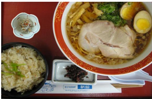
尾道ラーメンセット(鯛めし付) 1,100円