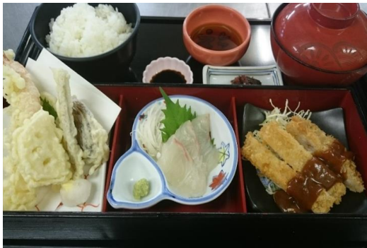
鞆絵よくばり御膳 1,280円 (天ぷら、トンカツ、鯛のお刺身)