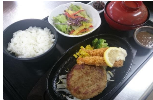
てごねハンバーグ&エビフライ定食 1,280円