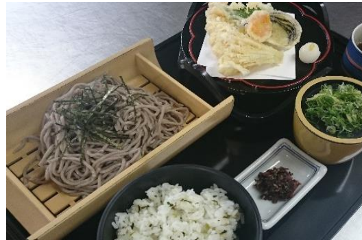
穴子天重ざるそばセット 1,180円