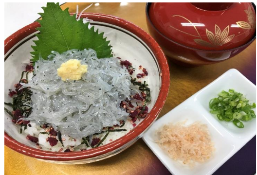
鞆の浦漁港直送 生しらす丼 1,080円