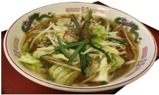
野菜たっぷりピリ辛ラーメン(にんにく入り) 900円