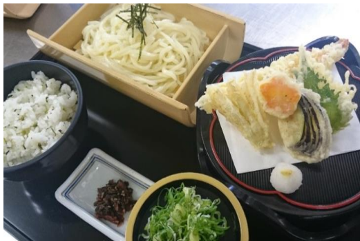
穴子天重ざるうどんセット 1,180円