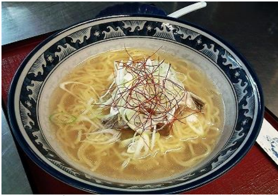
鯛潮ラーメン 750円 鯛潮ラーメン