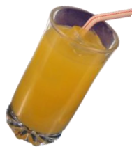
オレンジジュース 300円