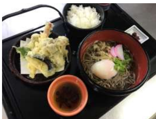
月見天ぷら御膳(そば) 1,180円