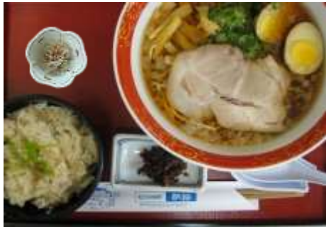
尾道ラーメンセット(鯛めし付) 1,100円