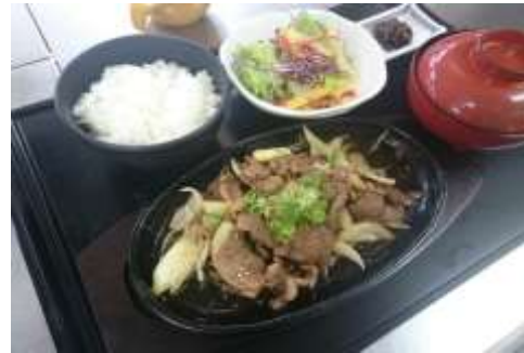
牛肉のスタミナ定食