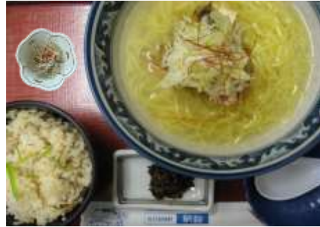
鯛潮ラーメンセット(鯛めし付) 1,050円