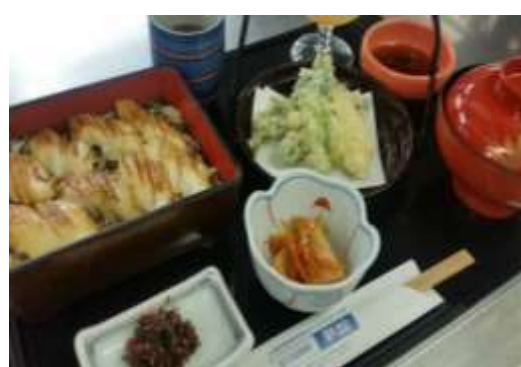
穴子蒲焼重御膳 1,380円 (天ぷら、小鉢、みかんゼリー)