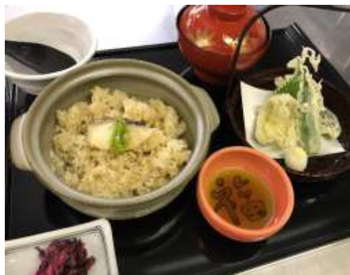
靱の浦御膳 (鯛めし) 1,100円