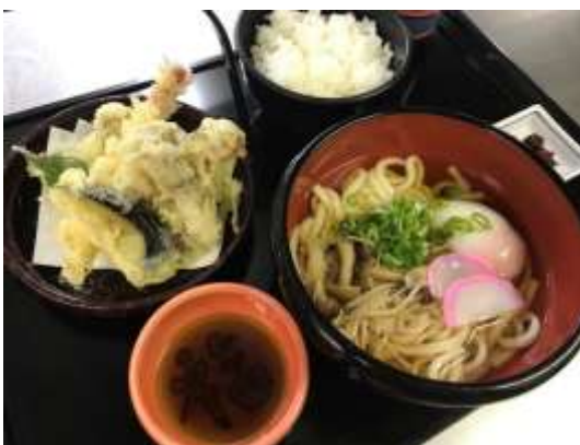
月見天ぷら御膳(うどん) 1,180円