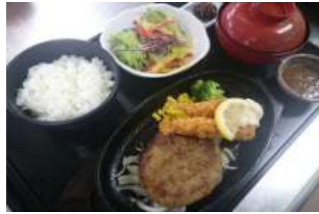
てごねハンバーグ&エビフライ定食 1,280円