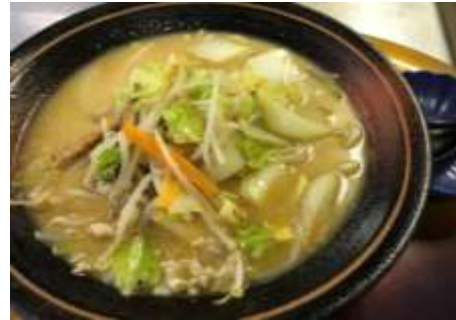
福山ちゃんぽん 900円 (名物じゃこ天入り)