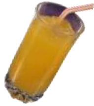
オレンジジュース 300円