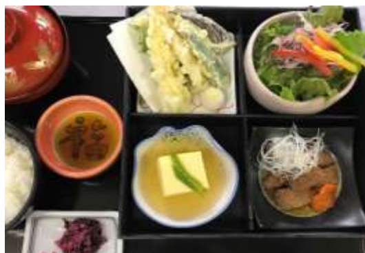
靱絵よくぱり御膳 1,280円 (天ぷら、サイコロステーキ、卵豆腐、サラダ)