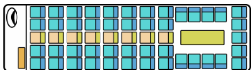
サロン向き 座席レイアウト