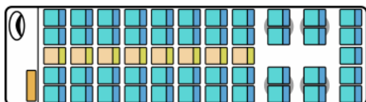
前向き 座席レイアウト