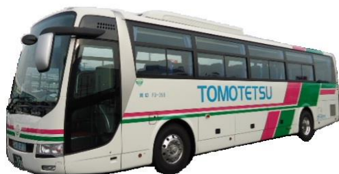
11列シート 大型 (正シート45 補助シート8)